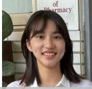
嘉南藥理大學 呂同學

經過了一個月的實習，讓我了解到之前學校沒有上過的實作課程，像是微生物檢驗，學校只有講義授課，沒有實際操作，非常開心的是多虧了這次實習，讓我實際操作到許多檢驗，像是內毒素試驗、革蘭氏染色法、菌種檢驗等.....十分感謝學長姐以及實習小夥伴這一個月的指教，真的讓我學到許多東西，收穫滿滿！