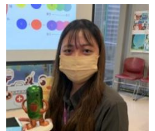
嘉南藥理大學 黃同學

實習前我以為行銷處是只有單單的藥品行銷，沒想到不只是運用行銷策略，也大量運用到許多藥學相關知識。舉辦不同種類的行銷活動，像是醫學會、攤位參展、舉辦Seminar、讓PM或外勤人員介紹產品，參與業務代表銷差.....很開心能夠來到永信實習，也在這裡有了寶貴的經驗以及美好回憶。